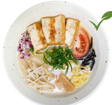
Veggie Miso M7 TOTU VEGGIE RAMEN €15.80 Gemüse-Miso-Brühe auf Salzbasis mariniertes Tofu mit Teriyaki Sauce, Kikurage Pilzen und Bambussprossen.