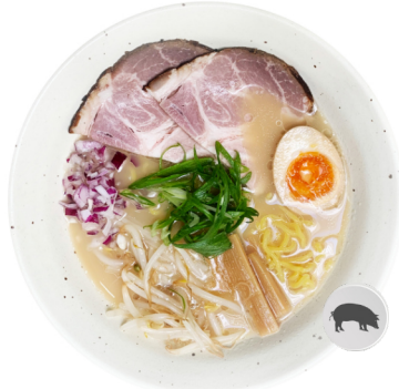
Tonkotsu Shio M1 CHASHU SHIO RAMEN €12.50 Tonkotsu auf Salzbasis. Schweinfleisch (Sous-Vide Art) und Ajitama.

Bitte fragen zu Allergenen, fragen Sie bitte unsere Mitarbeiter.