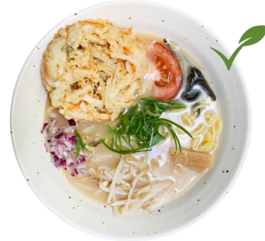
Veggie Miso M12 TEMPURA VEGGIE RAMEN €16.80 Gemüse-Miso-Brühe auf Salzbasis. Gemüse Tempura, geröster Tomaten Kikurage Pilzen und Bambussprossen.

*Alle Ramen mit Bamboosposson, Sojasproßen, Zwieben, Frühlingswiebeln und sesam.