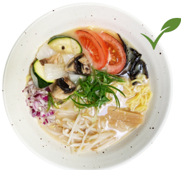
Veggie Miso M8 VEGGIE MISO RAMEN €14.80 Gemüse-Miso-Brühe auf Salzbasis. Geröster Tomaten und Zucchini, Kikurage Pilzen und Bambussprossen.

VEGGIE MISO (ohne Fleisch) - Kombu Suppe mit Miso-Würzpaste +€1.20