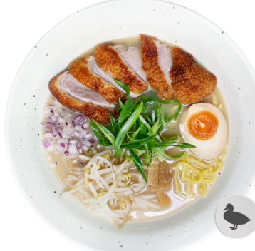
Tonkotsu Shio M11 ENTE RAMEN €17.80 Tonkotsu auf Salzbasis. Ente und Ajitama.