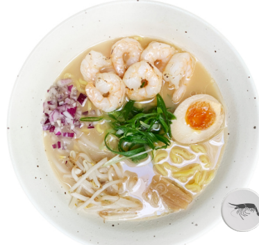
Tonkotsu Shio M10 SURF RAMEN €16.80 Tonkotsu auf Salzbasis. Gegrillte Garnelen und Ajitama.