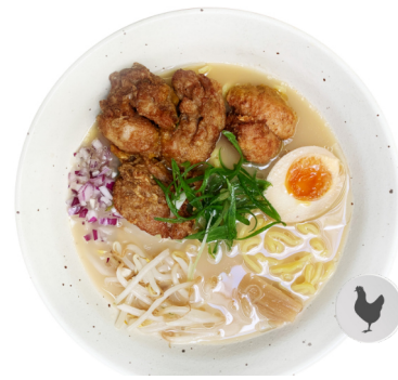
Tonkotsu Shio M9 KARA-AGE RAMEN €15.80 Tonkotsu auf Salzbasis. Frittierte Hähnchenfleisch und Ajitama.