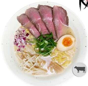
Tonkotsu Shio M2 GIKU SHIO RAMEN €14.80 Tonkotsu auf Salzbasis. Rindfleisch (Sous-Vide Art) und Ajitama.