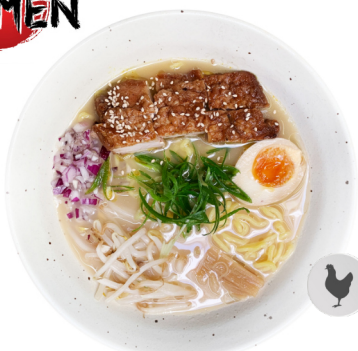
Tonkotsu Shio M14 TERRIYAKI RAMEN €14.80 Tonkotsu auf Salzbasis. Gegrilltes Hähnchenfleisch mit Teriyakisauce und Ajitama.